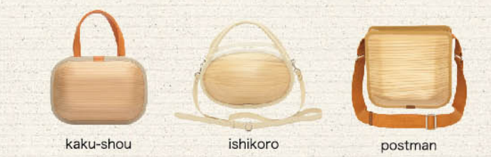
kaku-shou ishikoro postman 株式会社 エコアス馬路村 HP http://www.ecoasu.co.jp/