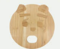
「木のマイうちわを作ろう」同時開催。