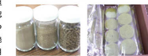
左から、明日葉のパウダー粉末、ペレット 明日葉パウダーを利用した焼き菓子