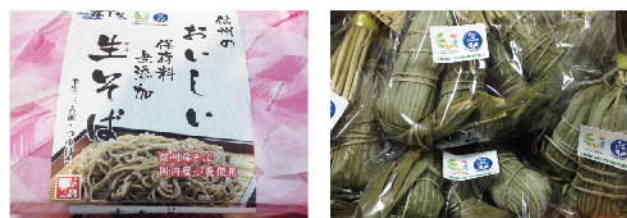
▲1商品につき1円が森林支援に!EVIシールを貼って、カーボン・オフセット付農産物になった木曾町特産のそばとちまき

1商品につき1円が森林支援に!信州木曾フェアが5月3日(土)~5月6日(火)名鉄百貨店本店7階催事場において開催されました。木曾町都市交流協議会と(株)ウェストボックスはEVIのプラットフォームを利用してEVIシールを添付したカーボン・オフセット付商品を販売しました。木曾町特産のそば、笹子、五平餅やゴーフレット、クランチなど環境貢献につながる商品としても注目されました。このようにEVIシールを活用し、お買物を通して環境貢献できる売り場づくりを目指しています。