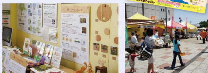
▲EVIの事業紹介や森のめぐみのおとりよせ商品を販売。 ▲外の会場も暑い中大にぎわいです。

EVIは足立区主催地球環境フェア(会場=足立区役所)に出展し、最先端の環境貢献事例や「森のめぐみのおとりよせ」からは森林支援につながる商品紹介をかねて間伐材を利用した木製品を展示販売いたしました。地元足立区の企業様、NPO法人、遠くは高知県など出展ブースは50を超えて両日とも炎天下にもかかわらず大勢の区民の皆様が来場。商品紹介をかねて販売した間伐材のうちわやピンパッチは人気がありました。また秋田県八峰町のカーボンオフセット付きしいたけ「八峰美人」も限定発売200個が完売。買って食べたらいよいよ次の日にまた買いにきましたというお客様もいて、「環境に貢献しているのがまたいいね」と。ミニステージにおいてEVIショー・プレゼンも行ないこどもでも分かるEVIビデオに親子でみっていました。