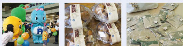
▲足立区の温暖化対策キャラクター ミリー、ドリー、リリー。 ▲今回も菌床しいたけ「八峰美人」200個完売です! ▲動物のピンパッチもかわいくラッピング!大好評でした。