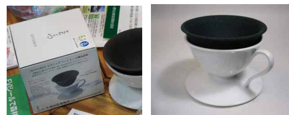
KYUEMON:セラミックフィルター