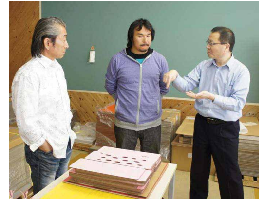
5月14日商品化に向け意見交換と技術確認