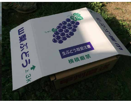
露地のさくらんぼ、桃、ぶどうの3種も環境貢献農作物として販売予定