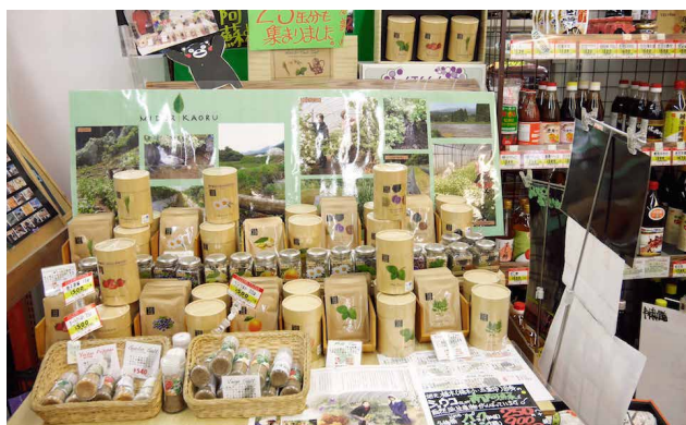
店内常設EVIコーナー