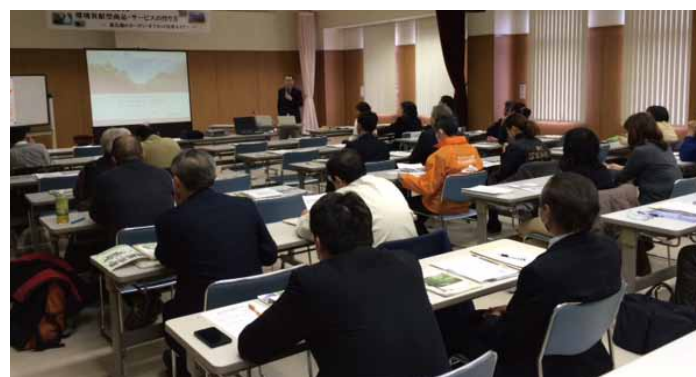
EVI加藤「普段のお買い物を通して環境貢献！もっと身近にカーボン・オフセット」