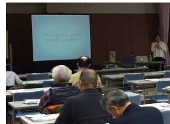
土屋えりか様「グリーン&グリーンリゾート？その果てしない魅力？」